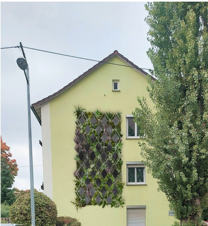
Visualisierung der vertikalen Klima-Kläranlage an einer Hauswand.

Ein ressourceneffizientes Wassermanagement kombiniert mit Photovoltaik-Modulen bei gleichzeitig innovativer Fassadenbegrünung. Das alles leistet FamoS. Das „Fassadenmodul mit Synergie“ bietet mit der Verbindung bereits bewährter Elemente einen wertvollen Beitrag im Kampf gegen den Klimawandel und zur Klimaresilienz von Städten.