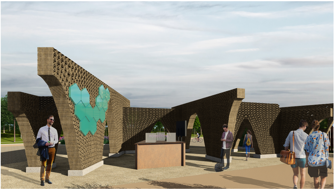
Entwurf des Demonstrationsbaus aus Weiden-Lehm-Komposit mit integrierten Solarpaneelen (grün) für die BUGA 2023 in Mannheim.